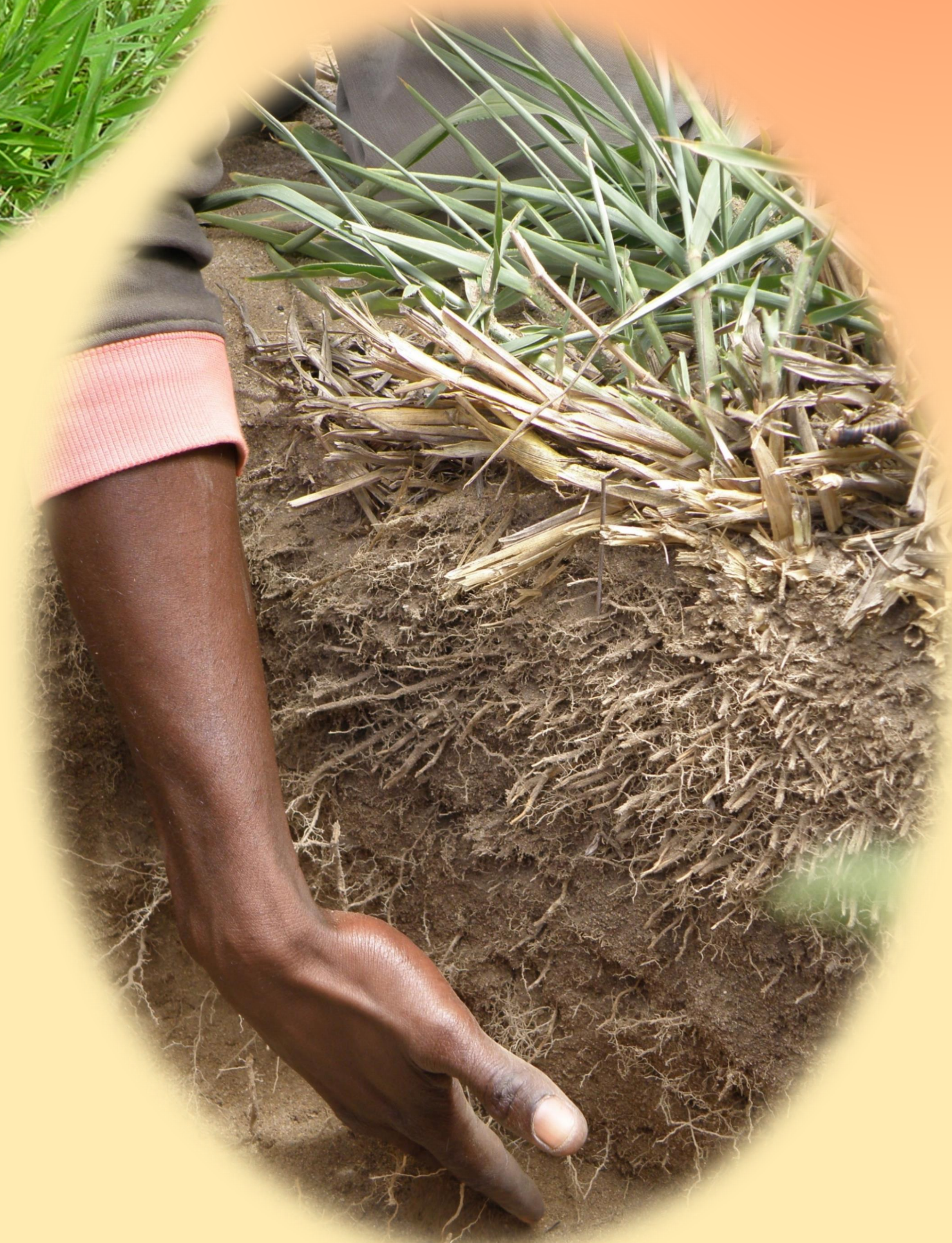
Les racines vont en profondeur